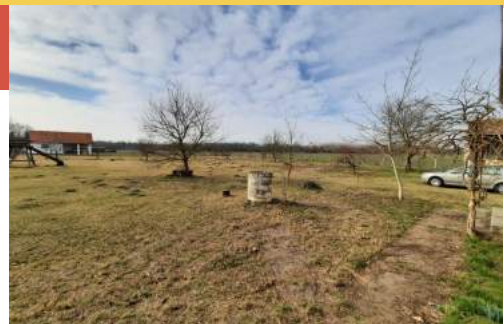
Ons tijdelijke huis

Naast met de hand wassen, ouderwets in een emmertje, hebben we ook maar wat dingen zoals pannen, borden, bestek, kopjes en een wasrekje aangeschaft. Daarnaast hebben we een router gekocht. We hebben weer Wifi. Super blij mee want internet is heel belangrijk voor ons om contact te houden met mensen in Oekraïne en Nederland.