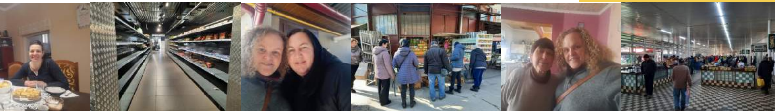
Collega's, de markt en lege schappen in de winkels