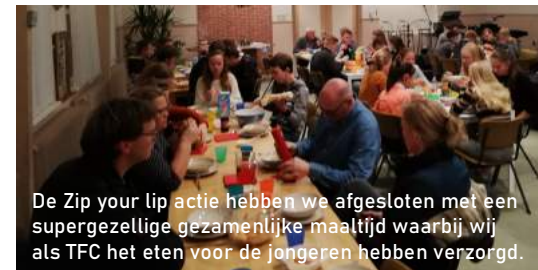
De Zip your lip actie hebben we afgesloten met een supergezellige gezamenlijke maaltijd waarbij wij als TFC het eten voor de jongeren hebben verzorgd.