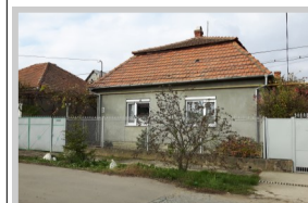
Het huis waar ik woon

jorienderuiter@hotmail.com www.childrencareoekraïne.nl IBAN - NL64 RABO 0148 8373 52 t.n.v. CG de Wingerd o.v.v. Children's Care Oekraïne