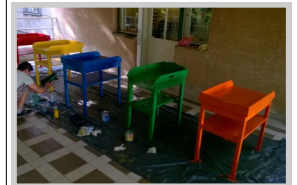
Schilderen van de aankleedtafels, kastjes, bedjes en muren

IBAN - NL64 RABO 0148 8373 52 t.n.v. CG de Wingerd o.v.v. Children's Care Oekraïne