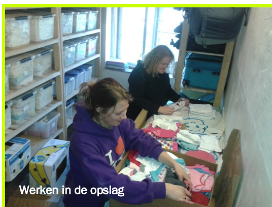
Werken in de opslag